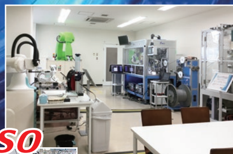
HCI ROBOT CENTER