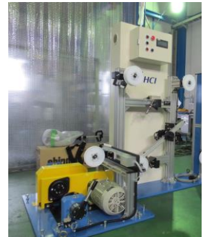
WPTuF (Fs)-A Series

撚線機・撚合機、押出機他加工ライン等から出線されたケーブル・ワイヤーを巻き取る巻取装置です。