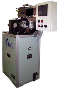
WTuF (Fs)-C Series